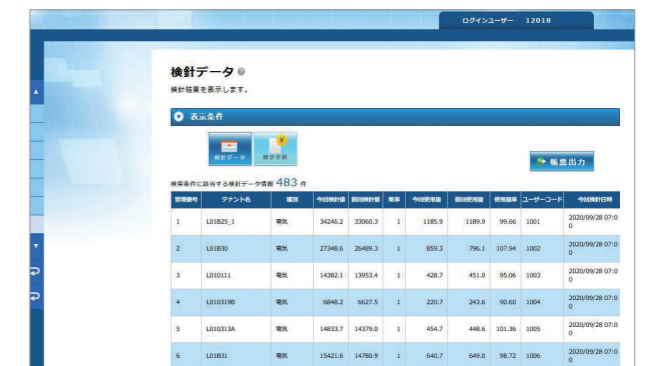
検針データ (CSV ダウンロード対応)