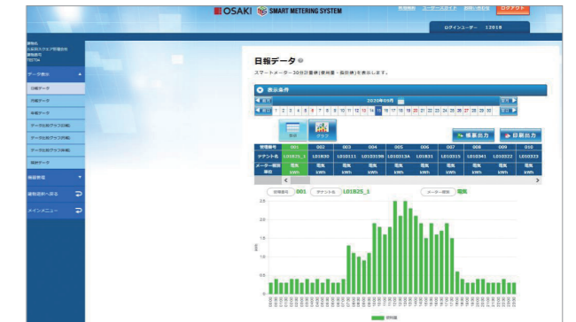
データ比較グラフ (日報)