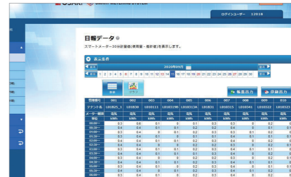
データ&グラフ (日報) (CSV ダウンロード対応)