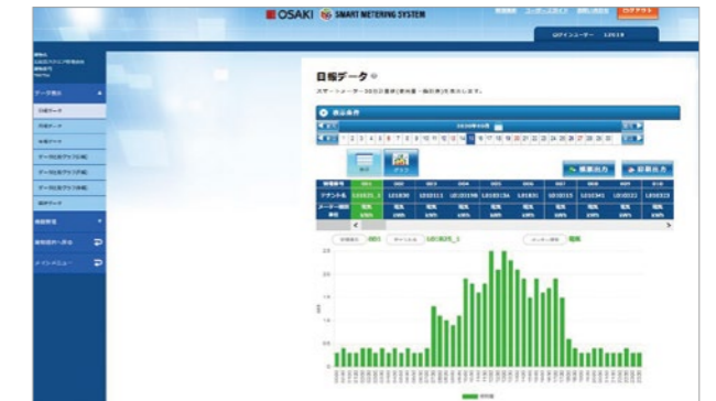
データ比較グラフ (日報)