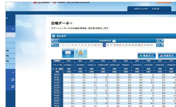
データ&グラフ (日報) (CSV ダウンロード対応)