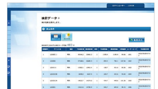
検針データ (CSV ダウンロード対応)