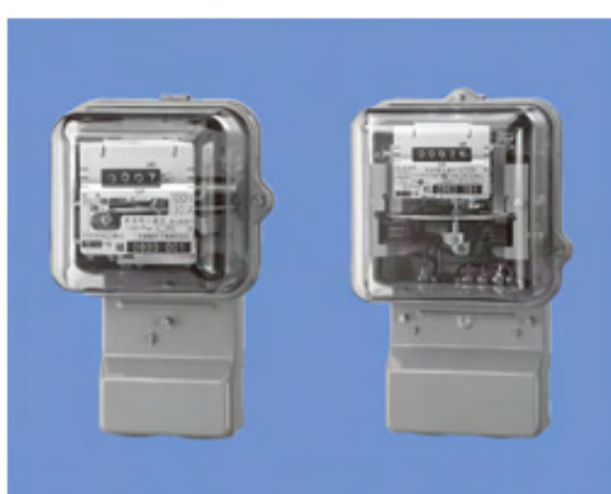
(左) A53WA (右) A73WA