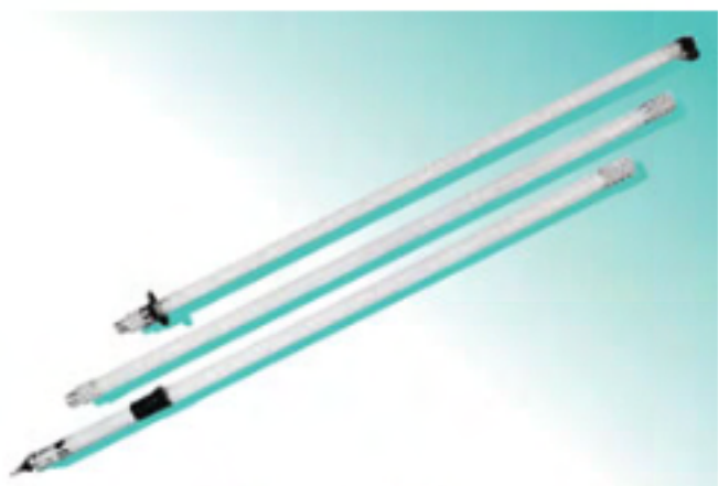
ODC-70 (上) ODC-150 (中) ODC-270 (下)